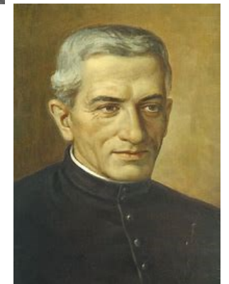
S Giuseppe Allamano